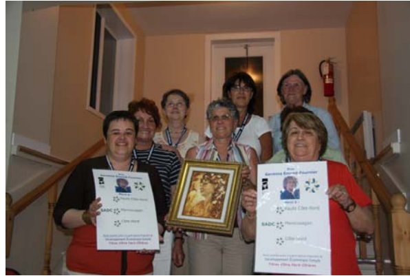
Quelques lauréates du Prix GEF

Une Nord-Côtière engagée localement et régionalement, une entrepreneure qui n'a jamais eu peur de s'investir et de foncer, une des premières membres du RFCN, une femme avant-gardiste et à l'esprit ouvert... Décédée en 2003, elle représente un modèle pour toutes les femmes désireuses de s'impliquer et/ou de démarrer en affaires.